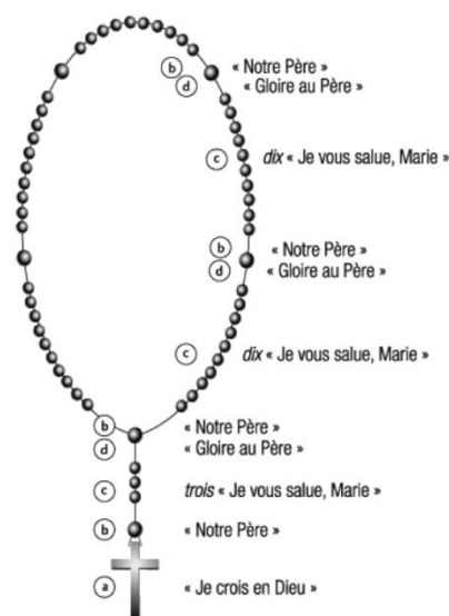
Chapelet « habituel »