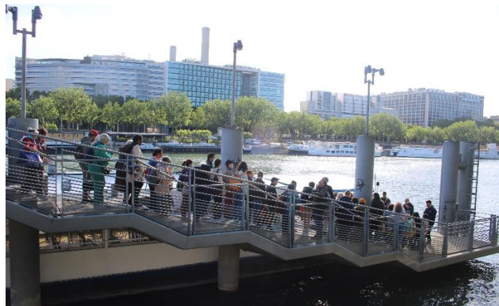
Le groupe des pèlerins embarque ...

Et la Joie n'a pas manqué lors de cette journée de pèlerinage paroissial vers la basilique Saint Denis ! Embarqués sur « la Guêpe Buissonnière », 170 paroissiens se sont retrouvés pour jeter les filets de la fraternité dans la joie et la bonne humeur.