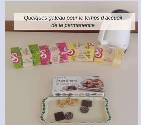
Quelques gateau pour le temps d'accueil de la permanence