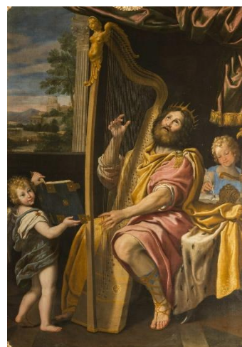
Le Roi David jouant de la harpe (Le Dominiquin, Musée du Louvre)

Nous avons à notre disposition des mots pour dire nos maux ! avec les deux cris essentiels : plaintes et louanges. Les grands priants de la Bible ont souvent commencé par le désespoir, mais comme Abraham, Moïse, David, et les Saints de tous les temps, ils ont fait confiance. Sauf trois psaumes, ils se terminent tous par une louange.